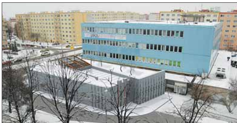
Lidé se také seznámili s budoucí podobou vestibulu stanice Petřiny.

Lidé se zajímali i o pokračující revitalizaci petřinského sídliště. Městská část po dohodě s obyvateli postupně upravuje vnitrobloky a okolí domů tak, aby prostor odpovídal jejich potřebám.