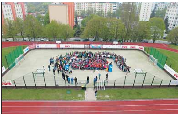
Žáci z Červeného vrchu vytvořili při slavnostním otevření zrekonstruovaného hřiště svými těly logo školy.

Nově zrekonstruované školní hřiště při základní škole Červený vrch prošlo hned po uvedení do provozu zátežkávací zkouškou v podobě okresního kola sportovní soutěže Odznak Všestrannosti Olympijských vítězů.