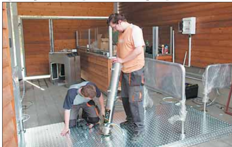
Poslední úpravy. Od května budou návštěvníci procházet novou letní pokladnou.

Kdo nemá možnost strávit na koupališti celý den, může nově využít hodinové vstupné. Podmínkou je za-